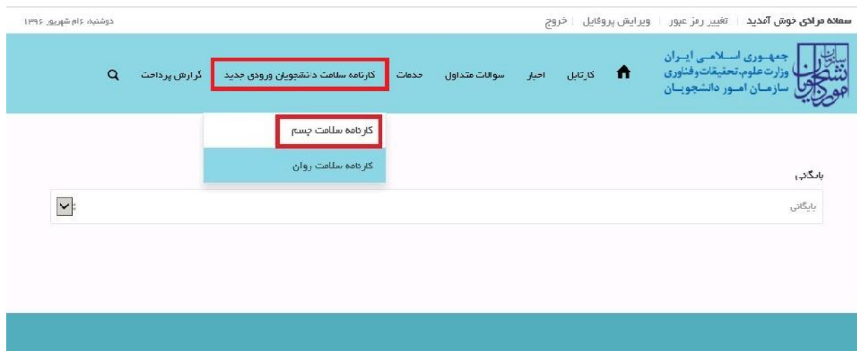
تصویر ۱-نمایش پورتال

پس از ثبت نام، از طریق پورتال سازمان امور دانشجویان و از سربرگ کارنامه سلامت دانشجویان ورودی جدید، جهت ثبت درخواست بر روی کارنامه سلامت جسم کلیک نمایید. (تصویر ۱)