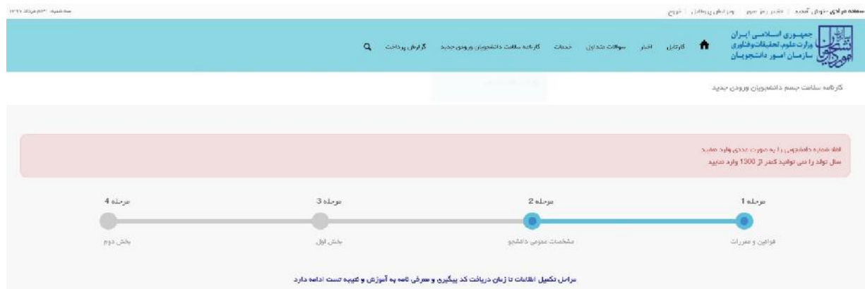
تصویر ۷-اعتبارسنجی فیلدهای اجباری

همچنین در صورت وجود مغایرت، سیستم موارد را به صورت تصویر زیر در بالای صفحه نمایش می دهد. (تصویر ۷)